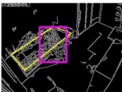
黄色い枠はベッドから出ようとしている状況。 赤い枠は、人物検知状況