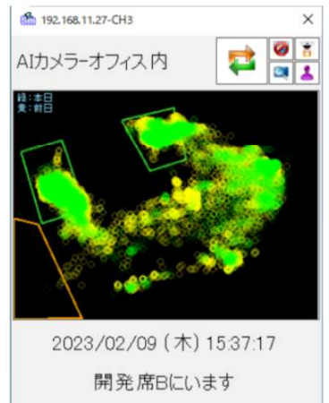
施設利用者さんの移動経歴状況